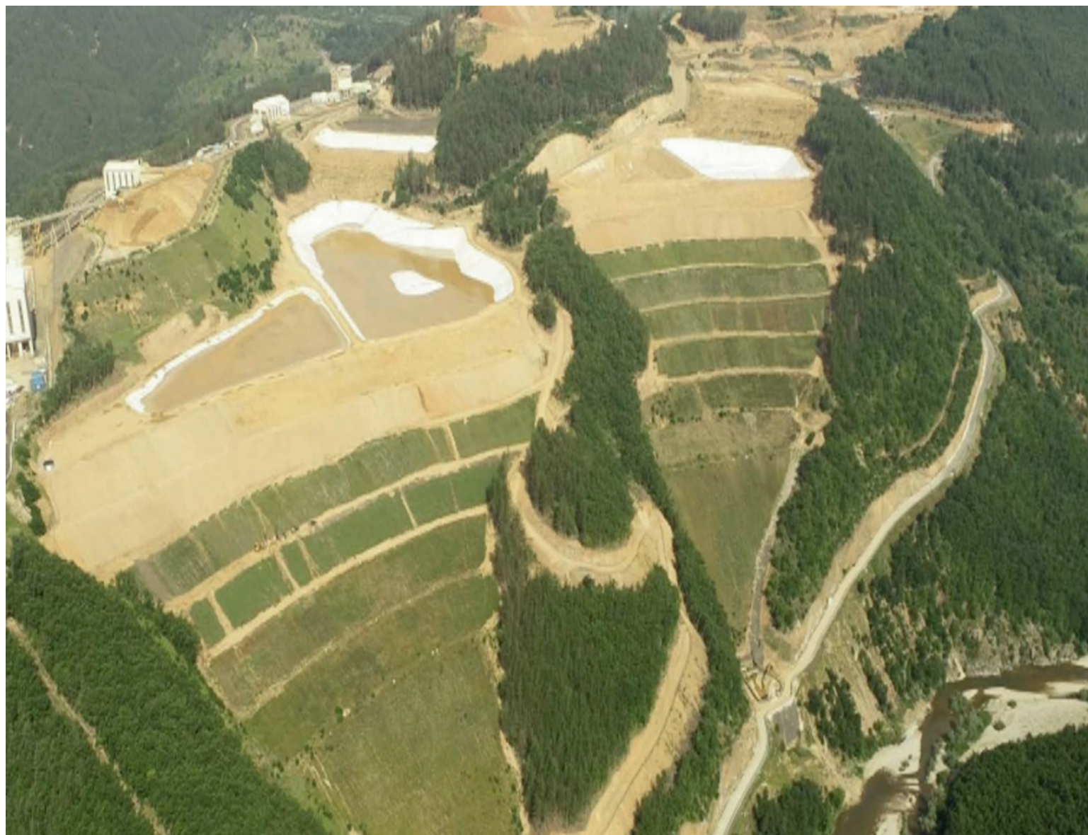
Slika 4. Rehabilitovano jalovište, Dundee Precious Metals