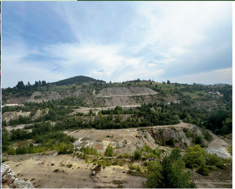
Slika 2. Otvoreni kop Veovača

Područje Veovača se nalazi unutar dijela sliva Male rijeke, gdje preferencijalni tok prolazi kroz područje otvorenog kopa, duž dna doline. Tok će biti u potpunosti zatvoren duž cijele svoje dužine kako bi se spriječila bilo kakva kontaminacija. Ovaj tok, koji potiče iz podzemnih voda blizu površine, spaja se s Malom rijekom nizvodno.