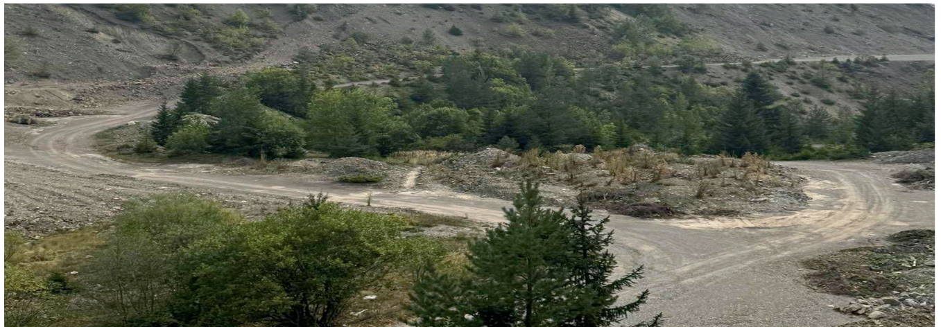
Slika 3. Postojeća cesta kroz kop Veovača

Postojeća cesta koja prolazi kroz kop Veovača ostat će dostupna za korištenje, kao i do sada. Ukoliko bude potrebno, cesta će biti prilagođena i unaprijeđena kako bi bolje zadovoljila potrebe lokalnog stanovništva. Kompanija Adriatic Metals osigurat će da svi infrastrukturni radovi budu izvedeni u skladu s najvišim standardima sigurnosti i kvaliteta.