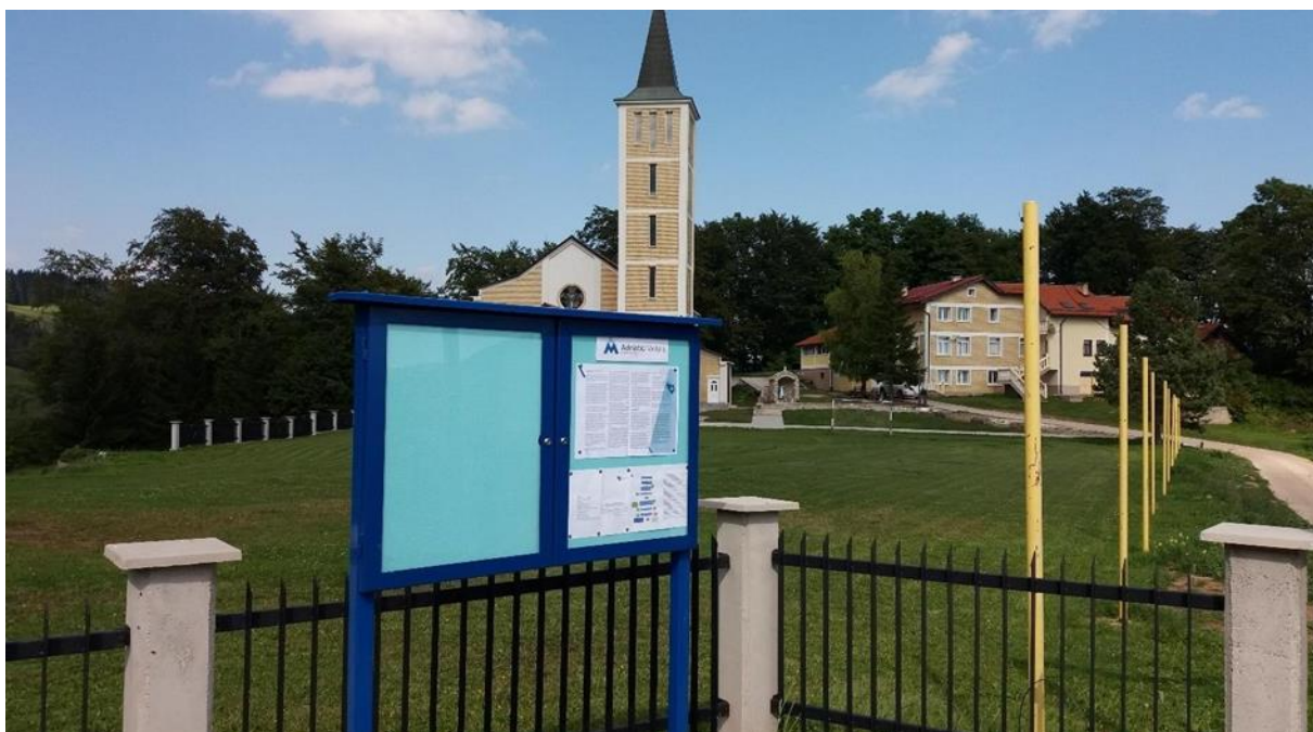
Slika 4.1.1. Oglasna tabla Borovica

Dokumenti i izvještaji koji su preveliki da bi bili objavljeni na oglasnim tablama su na bosanskom jeziku dostupni u Informativnom centru i moguće ih je preuzeti s Adriatic Metals BH web stranice te su dostupni i kod predsjednika mjesnih zajednica.