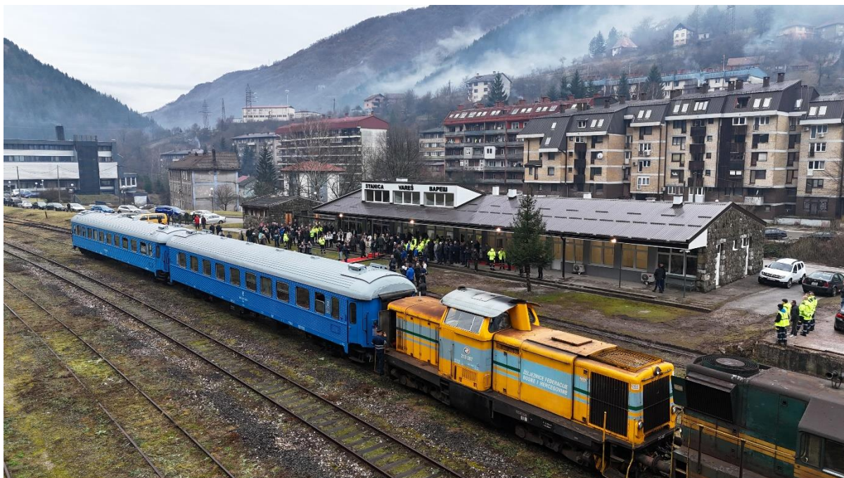
Slika 3.2.5 Obilježavanje obnavljanja željezničke linije Vareš - Podlugovi

primarnom svrhom prevoza ruda koje će Adriatic Metals BH eksploatirati u nedavno otvorenom rudniku u Varešu. Svečanosti su prisustvovali visoki zvaničnici, među kojima: generalni direktor Adriatic Metals BH, Paul Cronin, načelnik Općine Vareš, Zdravko Marošević, ministar komunikacija i prometa, Edin Forto, te premijer ZDK, Nezir Pivić, zajedno s predstavnicima Adriatic Metals BH, federalne i kantonalne vlade, kao i brojni građani Vareša. Ovaj događaj označava važan korak u infrastrukturnom razvoju područja, potičući ekonomski napredak i otvarajući nova radna mjesta.